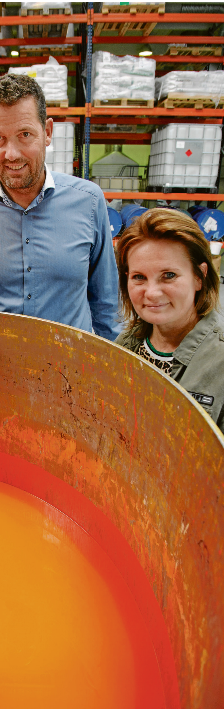
vægt på, at ansætte medarbejdere med stærke kompetencer inden for maling.