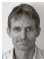
Tekst og foto: Eskil Mann Sørensen

Nowocoat i Kolding har bygget en moderne farve- og lakfabrik og vokser med stor fart. Virksomheden leder efter kompetente "nørder" inden for maling